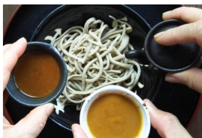
たれ味噌 練粕たれ だし醤油

からめそばは、醤油、味噌、練粕の中から お選びいただき、それらのたれをかけて 混ぜてお召し上がりいただくもので、 古くから人気のお召し上がり方です。